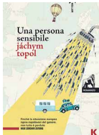
• "Una persona sensibile"