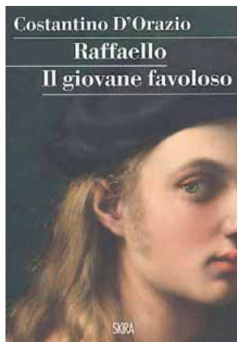
• "Raffaello - Il giovane favoloso"

Storie, aneddoti e retroscena di un Raffaello "privato". Un artista che dopo cinque secoli anni continua a stupire per il suo eccezionale talento, per aver costruito immagini meravigliose e vive, nelle quali ogni personaggio ha un proprio ruolo, una propria presenza scenica, una propria storia da raccontare. In questo caso lo storico dell'arte fa parlare i personaggi