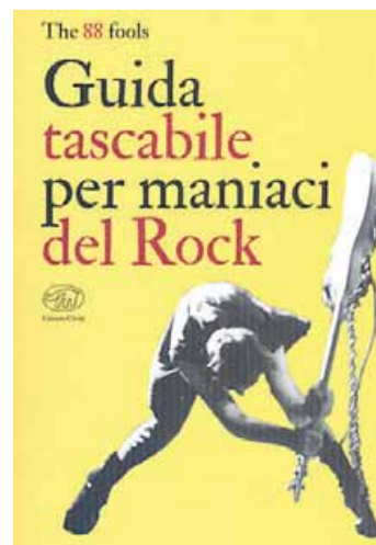
• La guida per i maniaci del rock