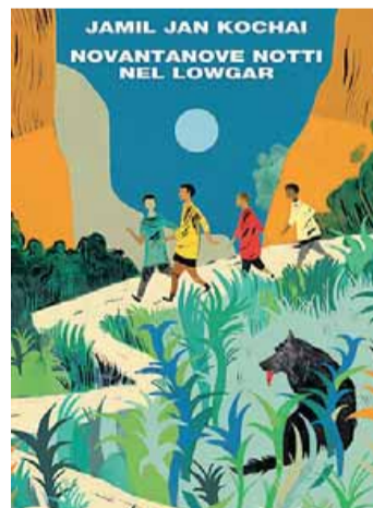
• "Novantanove notti nel Logwar"