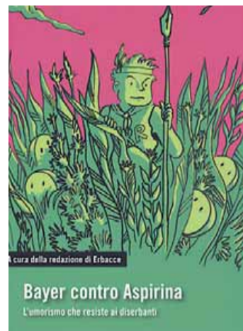
• "Bayer contro Aspirina"

L'ultimo suggerimento è di lettura e... ascolto